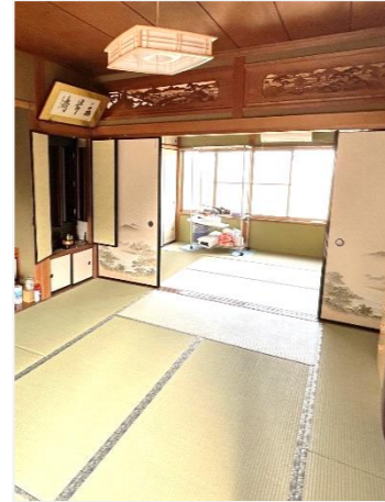
【和室】 ふすま張替。 畳も新品に入れ替え 綺麗になりました。