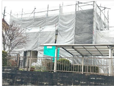
全面足場を組んで