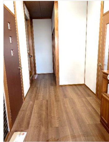
【玄関ホール】 床の色と壁紙の色の対比が モダンでとても素敵。

亀山市の改修工事の現場です。 11月から始まった外壁張替工事、1月からの内部改修工事も 2月末に完了し無事に引き渡しを終えました。 在宅ワークを谷川工場の事務所でき、お願いしたり 早朝からの工事を了承して頂いたり お客様のご協力なくして計画通りには進めませんでした。 本当にありがとうございました。 穏やかで上品。素敵なお夫婦でした。私の理想の夫婦像。