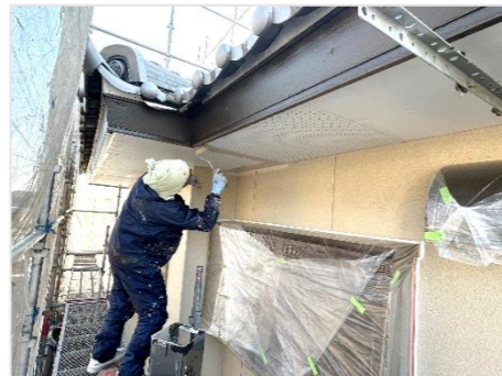
塗装屋さんが丁寧に 塗替えしています。