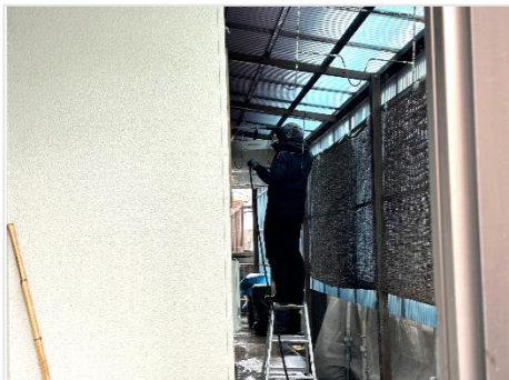
塗装工事の為 高圧洗浄しています。