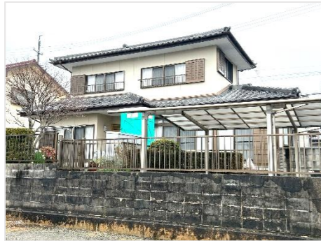
3月上旬から作業開始。