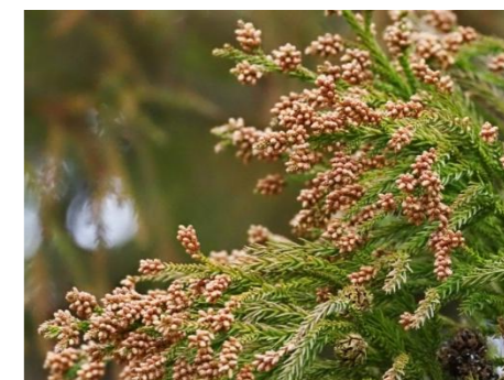
スギ花粉。 見るだけで身震いする…。