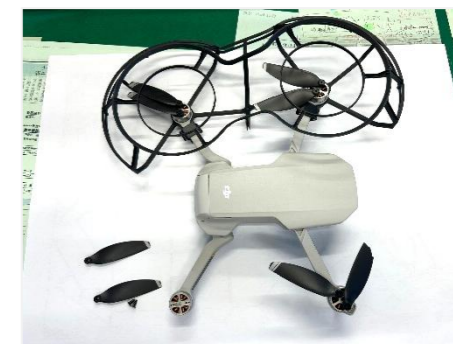
もう限界…と声が聞こえそう。