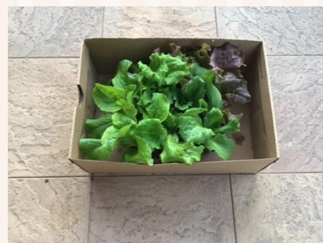
買ってきた3種類のレタス苗。 暖かい気候のせいか 植える前から、スクスクと成長中。