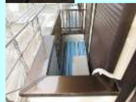
アルミ手摺・ベランダ