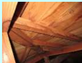
天井裏で雨漏り確認

今回のリフォームの現場は・・・ 以前から雨漏りがあり屋根瓦葺替えの依頼。 工事内容：和瓦から洋陶器瓦（銀色）に葺替え 樋も取替・腐食した鉄製手摺取替、 ベランダの雨漏り修理（壁・床） 塗装（外壁・雨戸・木部・門） 玄関天井の塗装