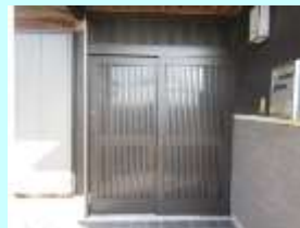
玄関引き戸取替後

工事内容：玄関引き戸の取替 広縁連窓サッシの取替 その他カーテン取替・障子の張り替え