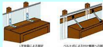
L字金具による固定

タンスなどの家具の固定はすでにお済みと思います。忘れがちなのが冷蔵庫やテレビ、レンジ、パソコンなど意外と高価な電化製品などがあります。また壁や天井に取り付けても強度の弱い所にとりつけている方もみえます。必ず柱などしっかりした箇所に取り付けましょう。位置によっては柱がない場合は90cm~1m間隔で柱はたいていあるので、柱と柱に板を打ち付けその板に取り付けましょう。