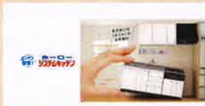
I型 2550 エマージユ

ショールーム展示品の入替のチャンス！！リフォーム時、この機会を利用して展示品を安く購入できます。今回はシステムキッチンとユニットバス ※展示品のためサイズや勝手方向に注意が必要です。