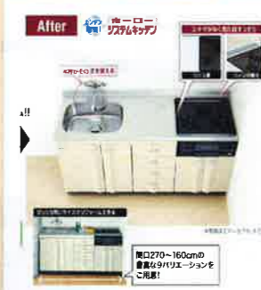
After 1616 ミーナ