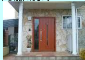
取替後 材工45万円(税込)